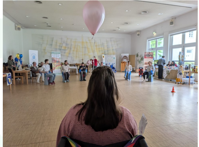
S. Friedrich, Haus Alte Gärtnerei