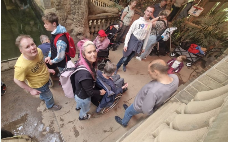
Haus am Teich

Zwischendurch stärkten wir uns bei einem gemeinsamen Mittagessen im Zoo, bei dem wir die Eindrücke des bisherigen Tages miteinander teilen konnten. In entspannter Atmosphäre genossen wir die Pause und sammelten neue Energie für weitere Entdeckungen. Der Ausflug war für alle Beteiligten ein wunderschönes Erlebnis voller Freude, Staunen und gemeinsamer Erinnerungen, das uns noch lange in positiver Erinnerung bleiben wird.