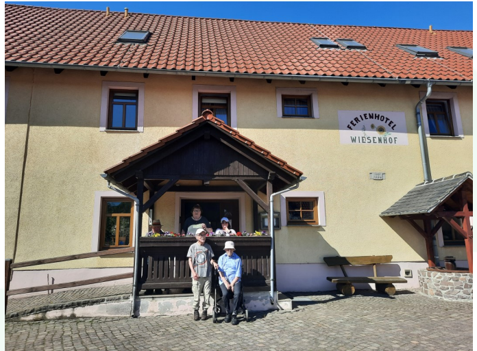
D. Hanke, Wohnbereiche am Rüstzeitheim

Am dritten Tag ging es nach Oschatz zum Gelände der Landesgartenschau von 2006 (LAGA). Der Oschatzpark begrüßte uns mit Tieren und Pflanzen sowie Gastronomie. Auch hier konnten wir alles barrierefrei erreichen. Am Abend gab es im Hotel immer ein reichhaltiges warmes Abendessen und der klang gemeinsam auf der Terrasse mit Brettspielen, Getränken und Gesprächen aus.